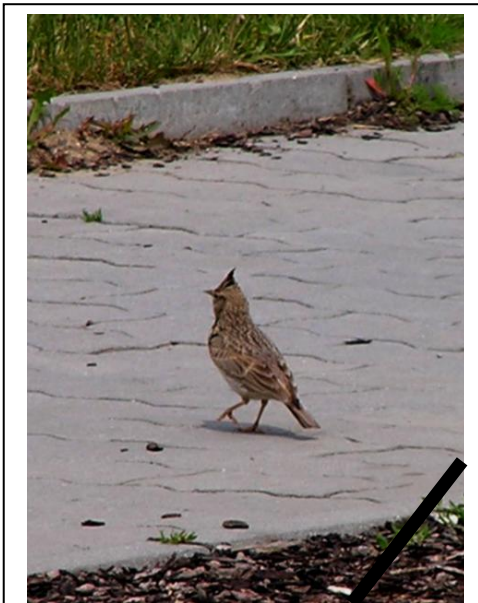
Chocholouš obecný ( Galerida cristata) – 11. 6. 2005 – Strakonice.

„Tak co, pozoroval jsi ptáky na krmítku o víkendu?“ „Jo, pozoroval. Ty ne?“ „Ne. Já takové... nedělám. To není nic pro mě“. Tak nějak probíhal rozhovor mezi mnou a mým kolegou na místech, kam chodívají páni bez dámského doprovodu. Jednalo se o účast na pozorování ptactva na krmítcích,