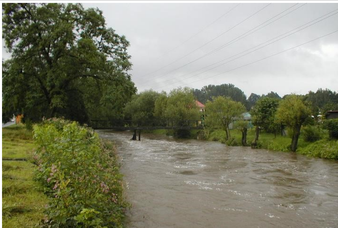
Volyňka varující 7. 8. 2002

A co mě k těmto článkům o průtocích v Otavě a Volyňce vedlo? Možná, že je to kousek historie vztahený k našim řekám zastoupený obrázky a fotografiemi minulého století a dalece i práce historické, literární nebo jen publikační zobrazující členitost Otavy a Volyňky z let o několik století