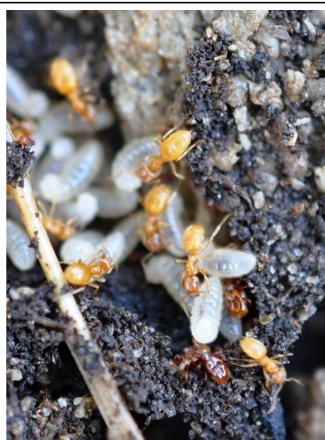
Mravenec žlutý ( Lasius flavus )

A opět cvrček. Jenže z hmyzu zde nebyl zastoupen sám. Pozorovali jsme na rozkvetlém hlohu dva druhy zlatohlávků. Zlatohlávka zlatého a zlatohlávka hladkého. Chvilkami bylo možno si všimnout podivného druhu hmyzu, kterého bych zařadil mezi srpice. Čas ukáže, co jsem viděl. Z měkkýšů pod drobnou skalkou ulity vlahovky narudlé ( Monachoides incarnatus ). Při hledání měkkýšů jsem odkryl placatý kámen. Místo nich jsem našel mraveniště, v němž rozrušeně pobíhali mravenci žlutí ( Lasius flavus ). Při podrobnějším pohledu jsem spatřil drobného brouka, kyjorožce narudlého