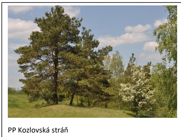
PP Kozlovská stráň

( Claviger testaceus ), který je u tohoto druhu mravenců častým a vítaným hostem. Mravenec žlutý nebyl jediným zástupcem mravenců. Kousek dál se nachází mraveniště mravenců rodu Formica. Čile pobíhající mravenci si vybudovali v kamenitém svazu drobné cestičky, které se zdají být od myší. Ale při bližším pohledu člověk zjistí, že jsou mravenčím dílem. A pečlivě o něj pečují. Stačí jim vložit do cesty drobnou překážku a již vznikne rozruch. Klubko těl překážku ohledává a nakonec si s ní poradí. Dalo by se sedět dlouho na tomto krásném místě. Jenže čas běží a člověk se musí vrátit. Tak