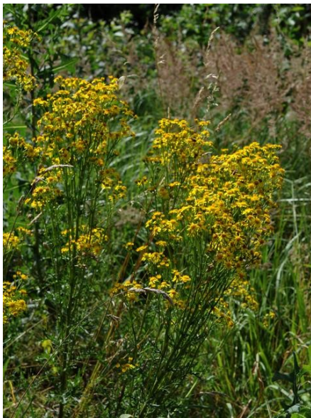
Loučka U Hajské ve Strakonících

Lidí, kteří se občas postarají o veřejné prostranství, ubývá. Myslím tím „zapomenuté“ pozemky vesnických či spíše městských dvorků, nikomu nepatřící meze nebo třeba prostory u garáží, kde si mnohdy dnes již nežijící majitelé prostor pro své motorové miláčky udělali (často i načerno) - plácek k opravě nebo čištění vozidel. Takové prostory dnes velmi často zarůstají v lepším případě travním porostem, řídkým ruderálem, nebo keřovými nálety. V tom horším se stávají skládkou. Čehokoliv. Od pomíjivých lidských a psích exkrementů přes opuštěné plechovky od piva či ionťáku, který sosače na síle nepozdvihl, zapomenuté lyžařské hůlky až po celá auta, která se časem a přičiněním kolemjdoucích sběratelů stávají stále většími a většími vraky. Doba krtečků opravářů zdá se pominula, a tak zmizení zapomenutého autíčka bude opravdu jen v animovaném filmu.