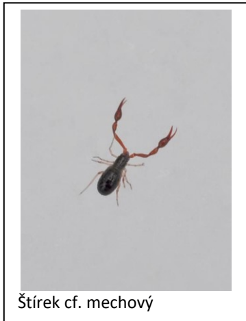
Štírek cf. mechový

Tak jsme si 11. prosince 2021 vykročili. Od pobočky Šmidingerovy knihovny s cílem jasným. Skrze kopce, vrstvu sněhu a bez slunečního počasí. Když jsem si spočetl počet účastníků, bylo nás skoro stejně jako pozorovaných strak v té době v Rennerových sadech, kterých bylo 7. Nás 9. Strakám to ale nevadilo. Létny si nad staronovým altánem, zejícím prázdnotou. Zato za pobočku bylo živo. Kavky obecné si pročišťovaly pírkou po nočním spaní. Okukovaly vletové díry v plášti střední průmyslové školy. Jen špačkové, kteří je na jaře střídají, a poštolky, které mladé špačky loví, byli kdesi pryč.