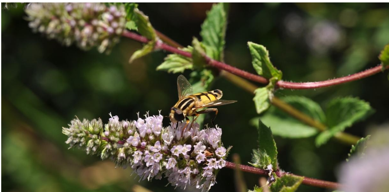
Pestřenka (Helophilus trivittus)

Chodím po zahrádce a občas se podívám na statný porost meduňky a bojovného řepíku. Vedle rostoucí máta právě kvete. Její světle modrá květenství jsou lákadlem pro několik zástupců blanokřídlého a dvoukřídlého hmyzu. Zejména, když se do květů opře sluníčko, záhon ožije. Nedaleko stojící komule Davidova připravuje zase vonné esence pro motýly. Zdá se, ráj na zemi.