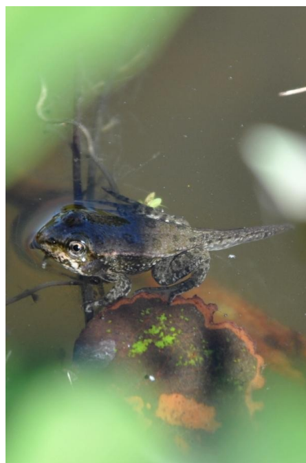
Skokan zelený ( Pelophylax esculentus )

Po chvíli se odněkud z vodního sloupce vynoří velcí pulci skokana zeleného ( Pelophylax esculentus ). Jejich větší sourozenci se ozvou kousek ode mě a odváží se na volnou hladinu. Trochu mně připomínají strakonické občany na našem Podskalí. Pomalá, rozvázná plavba. Neochvějně vpřed.