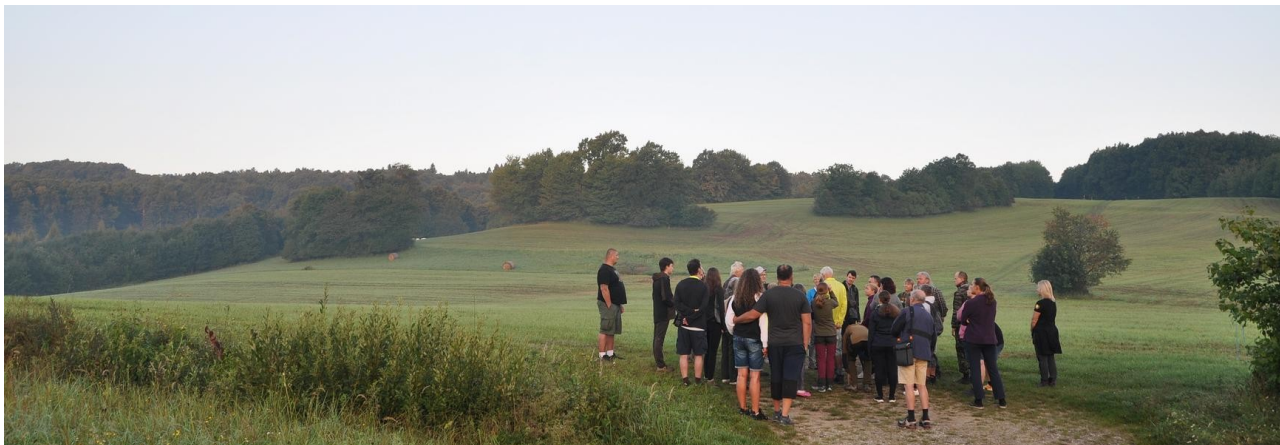
Ranní ornitologická vycházka

Přichází podzim. A s ním akce setkání členů a přátel ČSOP. Lidé se sjíždějí ze všech koutů České republiky, aby si vyměnili zkušenosti, popovídali si, získali informace. Nebo si jen tak odpočinuli. Letošní sraz se konal ve Štramberku. Přesněji v kempu Sv. Kateřina, ve dnech 8. až 10. září 2023. Cesta tam byla z jihozápadních Čech dlouhá. K jejímu poklidu nepřispívalo ani velmi teplé počasí, ani dopravní ruch na komunikacích. O to příjemnější bylo potom posezení pod vzrostlými stromy příjemně umístěného kempu nedaleko Štramberka.