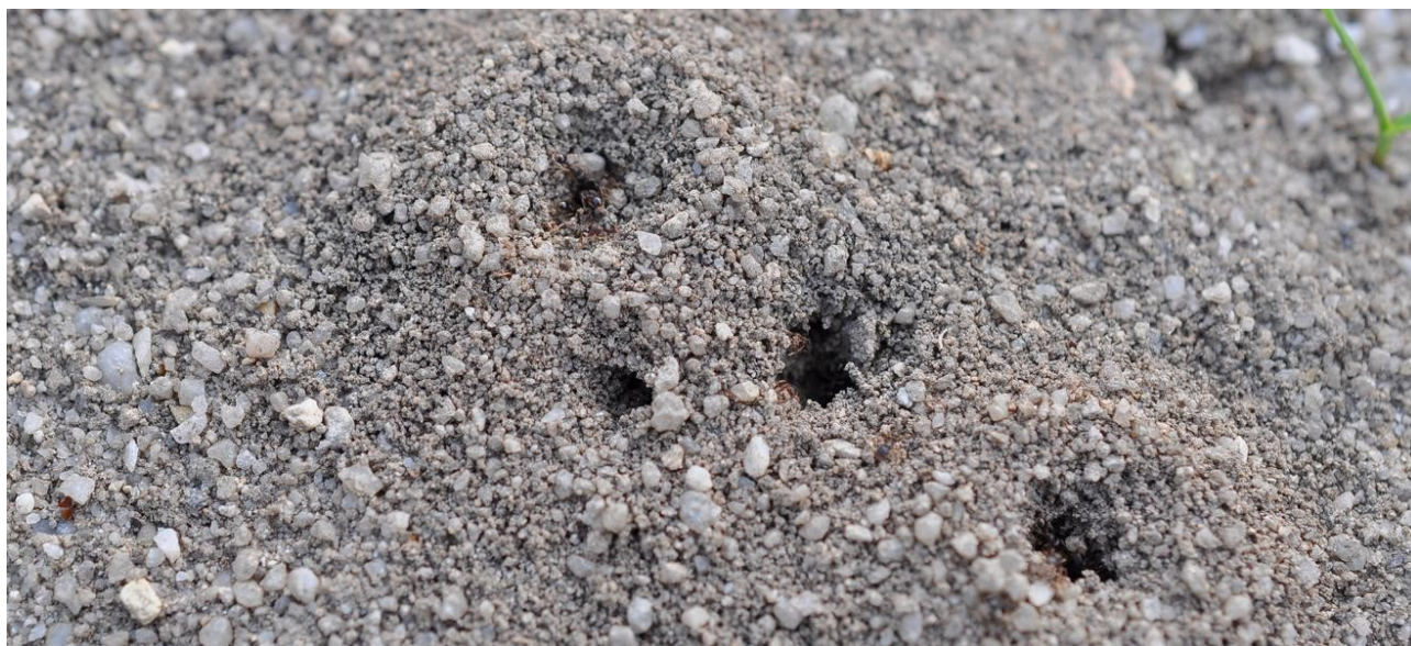
Mraveniště a dětské hřiště

Potloukám se na okraji města Strakonice se skupinou Ledňáčků – Mladých ochránců přírody. Vycházka je jarní a malé děti si mají zahrát klasickou jarní hru, kuličky. Jen hliněné již nejsou. Tento herní produkt již vyrábí pár nadšenců v naší republice a k nám proudí skleněnky asijské. Jsou asi trochu těžší a větší, ale použít se dají.